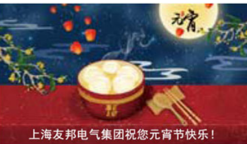
上海友邦电气集团祝您元宵节快乐！

农历正月十五 (3月2日) 元宵节 又称上元节、元夜、灯节 正月是农历的元月 古人称夜为“宵” 圆滚滚的汤圆，红彤彤的灯笼， 再次将新年的氛围推向高潮！ 盏盏花灯报元夜，岁岁瑞雪兆丰年， 玉烛长调千户乐，花灯遍照万家春， 上海友邦电气集团 在此恭祝大家元宵节快乐！