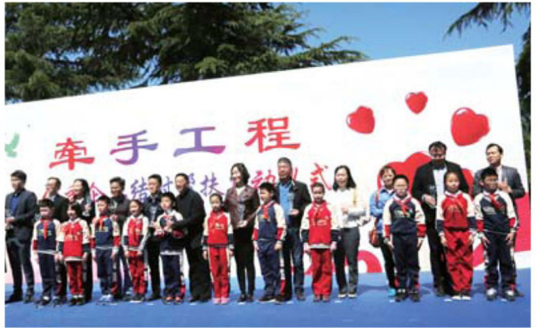
▲佘山学校优秀少先队员上台为32家优秀企业颁发爱心牌

社会的责任。上海友邦电气集团此次能够参加这么有意义的活动，不仅雪中送炭送出了困难家庭“牵手工程”正式启动。